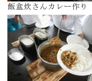
飯盒炊さんカレー作り