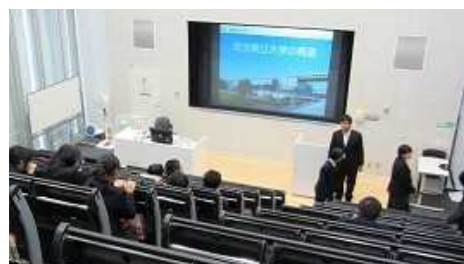
埼玉県立大学にて