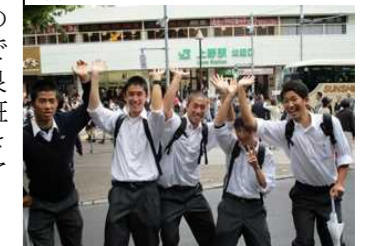
上野駅をバックに