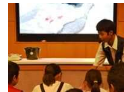
血痕か?ここは犯罪現場?

ルミノール反応は推理ドラマでもおなじみ、犯罪現場に残された血痕の検査に利用される化学反応で、お客さんも興味津々でした。また、スポイトの先から水中に徐々に産み出された(?)人工イクラは、プニプニ感も本物そっくり。「イクラかな、いくらなの?…」、楽しい実験に、ちびっ子たちはすっかり虜(とりこ)になりました。