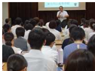
校長挨拶(視聴覚室)

8月27日(月)、第1回学校説明会を開催しました。715名の中学生・保護者が参加いただきました。暑さの厳しい時期であり、3会場(視聴覚室他)・4部制で実施しました。多数の参加ありがとうございました。