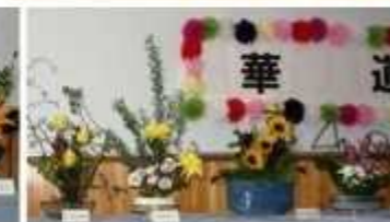
茶道同好会の皆さん／華道部作品（一部）