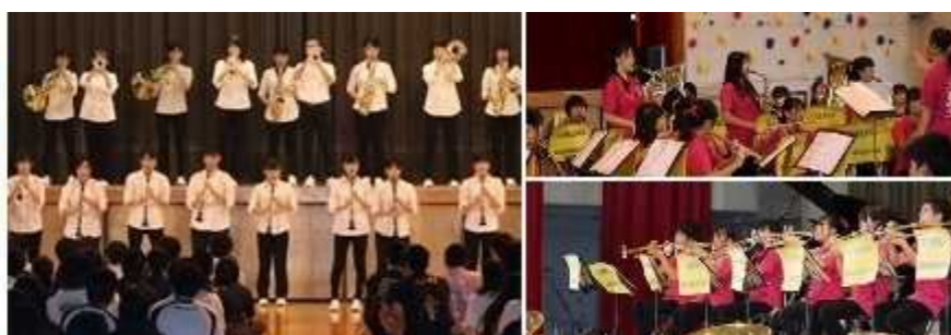
吹奏楽部（開会セレモニー／ステージ発表）