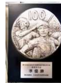
準優勝記念杯(本校玄関前に展示しています) / 川高選手団・応援団

選手の皆さん、準優勝、おめでとうございました。また、在校生・卒業生・保護者等々、多くの皆様がチーム川高として全力で応援して下さいました。炎天の下での厳しい試合でしたが、選手を支える大きな力になりました。応援、ありがとうございました。