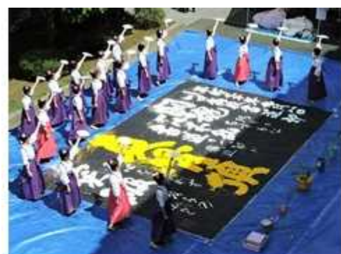
お茶会（茶道同好会）／生け花（華道部）

本日のお軸は「歩歩是道場（ほほこれどうじょう）」。『私たちの周囲はすべてが学びの場である』という意味の禅の言葉です。学ぶ気持ちさえあれば、いつでもどこでも学ぶことができるという態度は、いつも心掛けていきたいものです。（茶）お花のいろいろな表情を楽しんで欲しいです。（華）