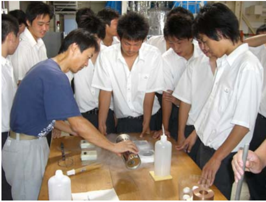
液体窒素を使用して、実験を実施している様子です。冷却した超伝導体の上に強磁石が浮かんでいます。